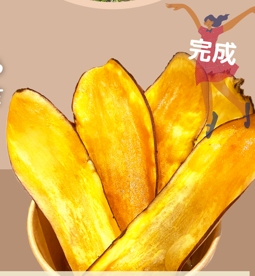
「幕張のおいもさん」出店

大切に育てたおいもを1枚1枚スライスし さつまいもチップスにしました。浜風祭にて販売します！